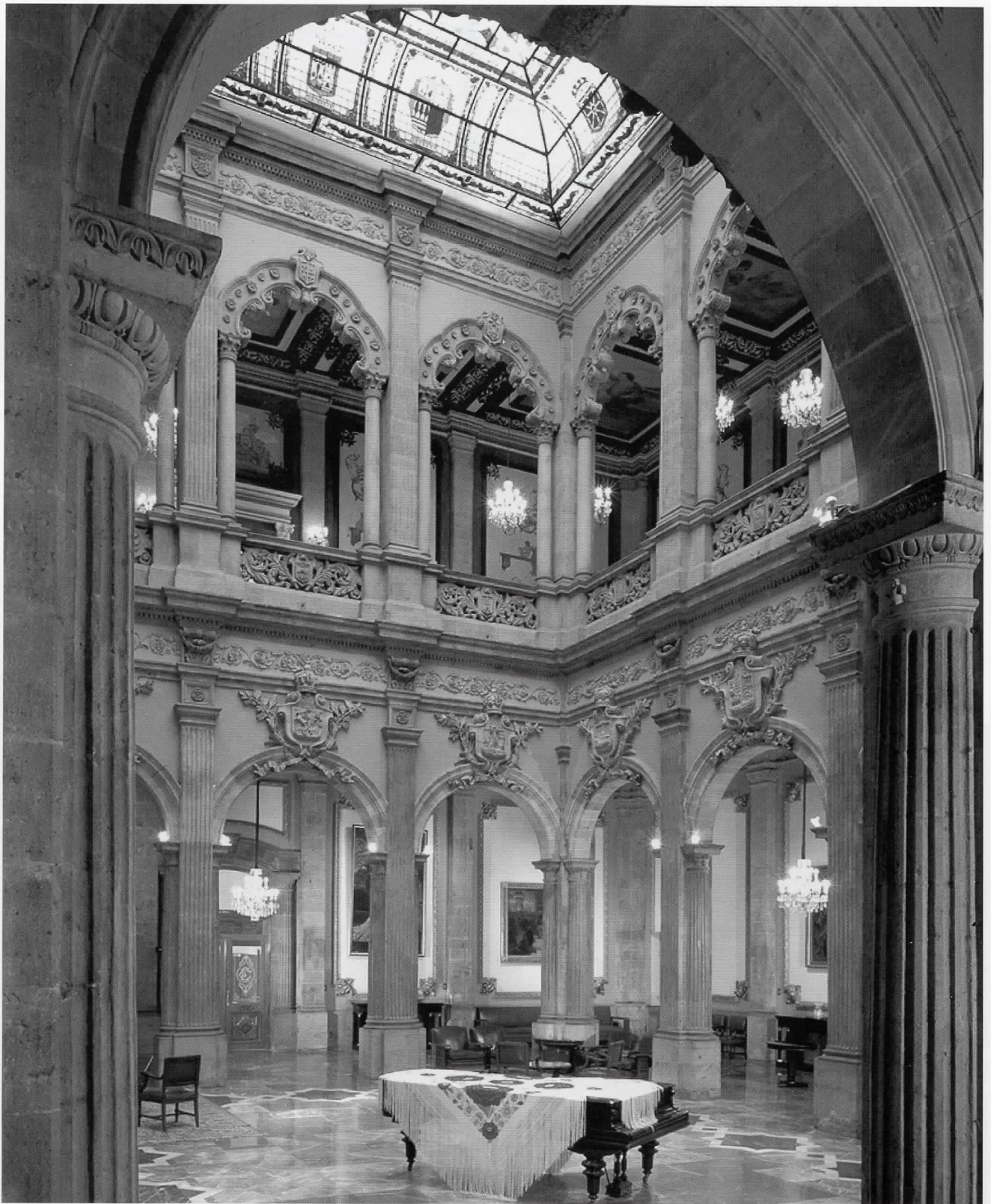
Patio principal del Casino Español