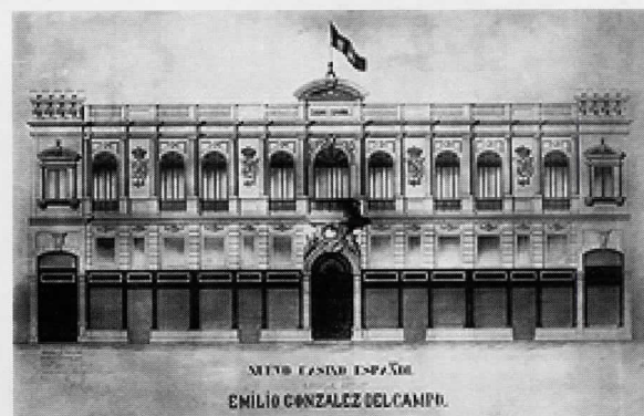
Fachada del Casino Español, dibujo original del proyecto de construcción del arquitecto Emilio González del Campo