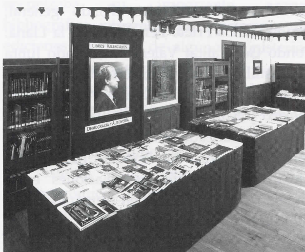
Vista de la Biblioteca Hispano Mexicana Carlos Prieto