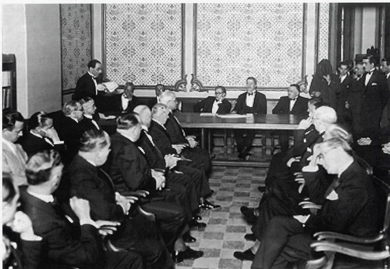
Conferencia en la Biblioteca del Casino Español, presidida por el embajador de la Segunda República Española, don Julio Álvarez del Vayo, 1931