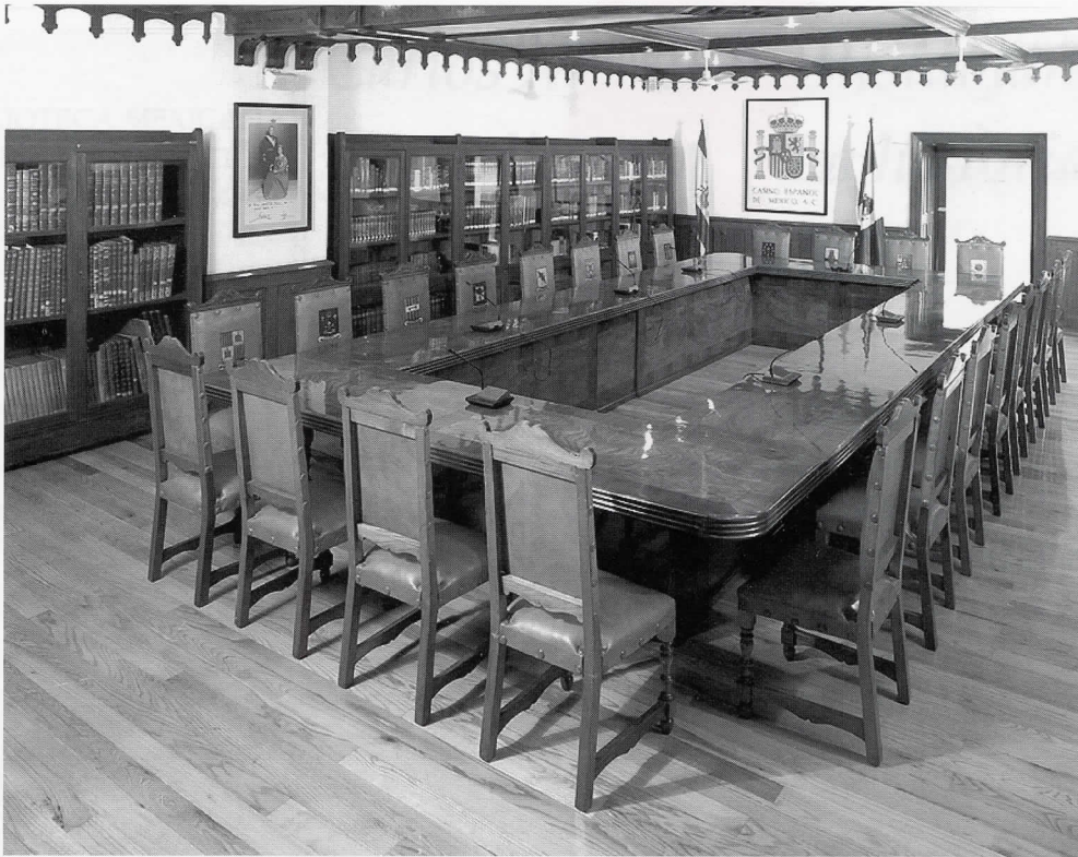
Sala de Juntas y de lectura