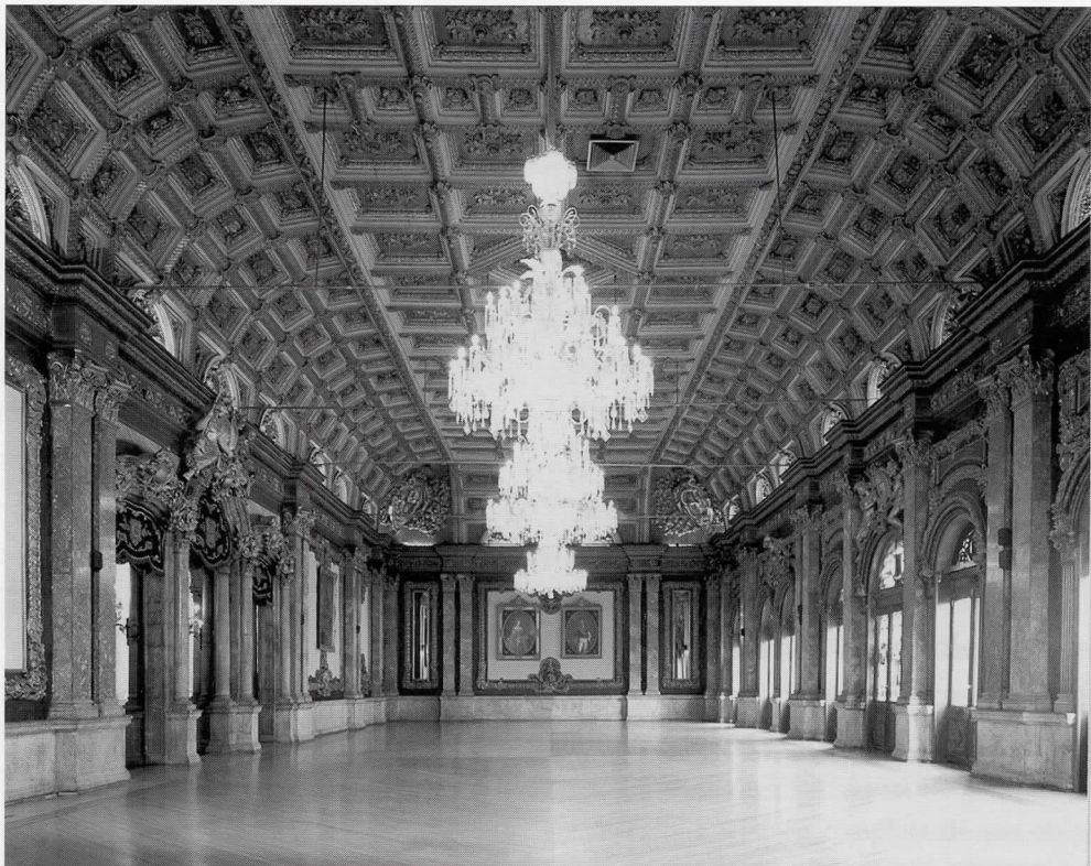
Salón de los Reyes