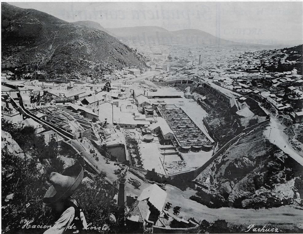
Hacienda de Beneficio de Loreto, CRM y P.Pachuca, Hgo. Ca. 1908