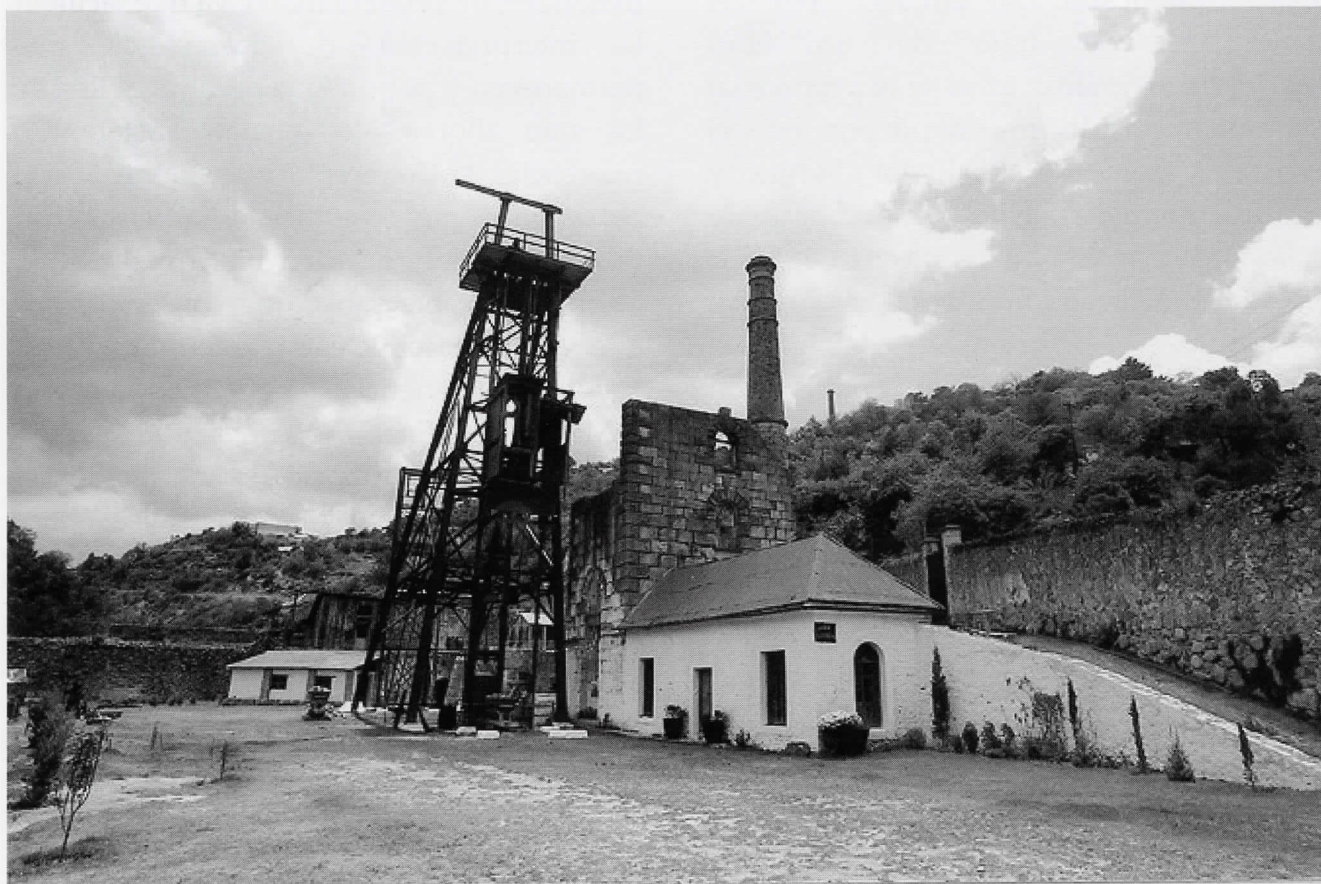
Museo de Sitio, Mina de Acosta, Real del Monte, Hgo. 2002.