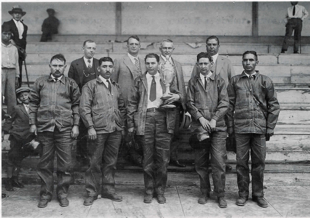
Equipo de Salvamento de la Cía. Real del Monte y Pachuca, Hgo. Ca. 1932.