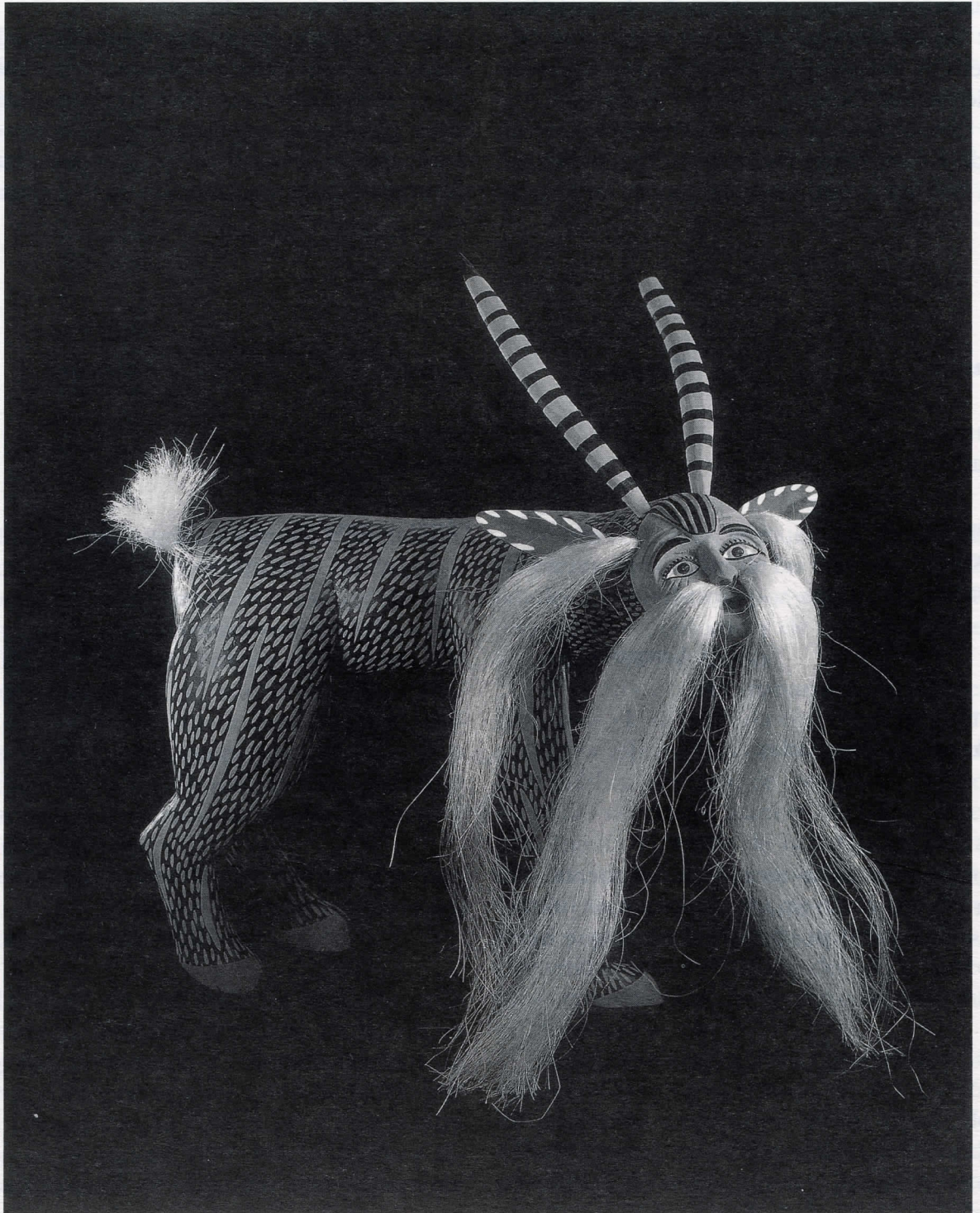
Manuel Jiménez Ramírez. Nabual , 1997. Madera tallada y policromada. Arrazola, Oaxaca. Col. Fomento Cultural Banamex, A.C.