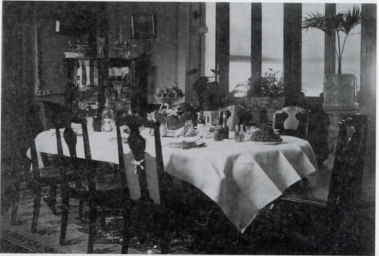
Fotografía 10 (Mención honorífica)