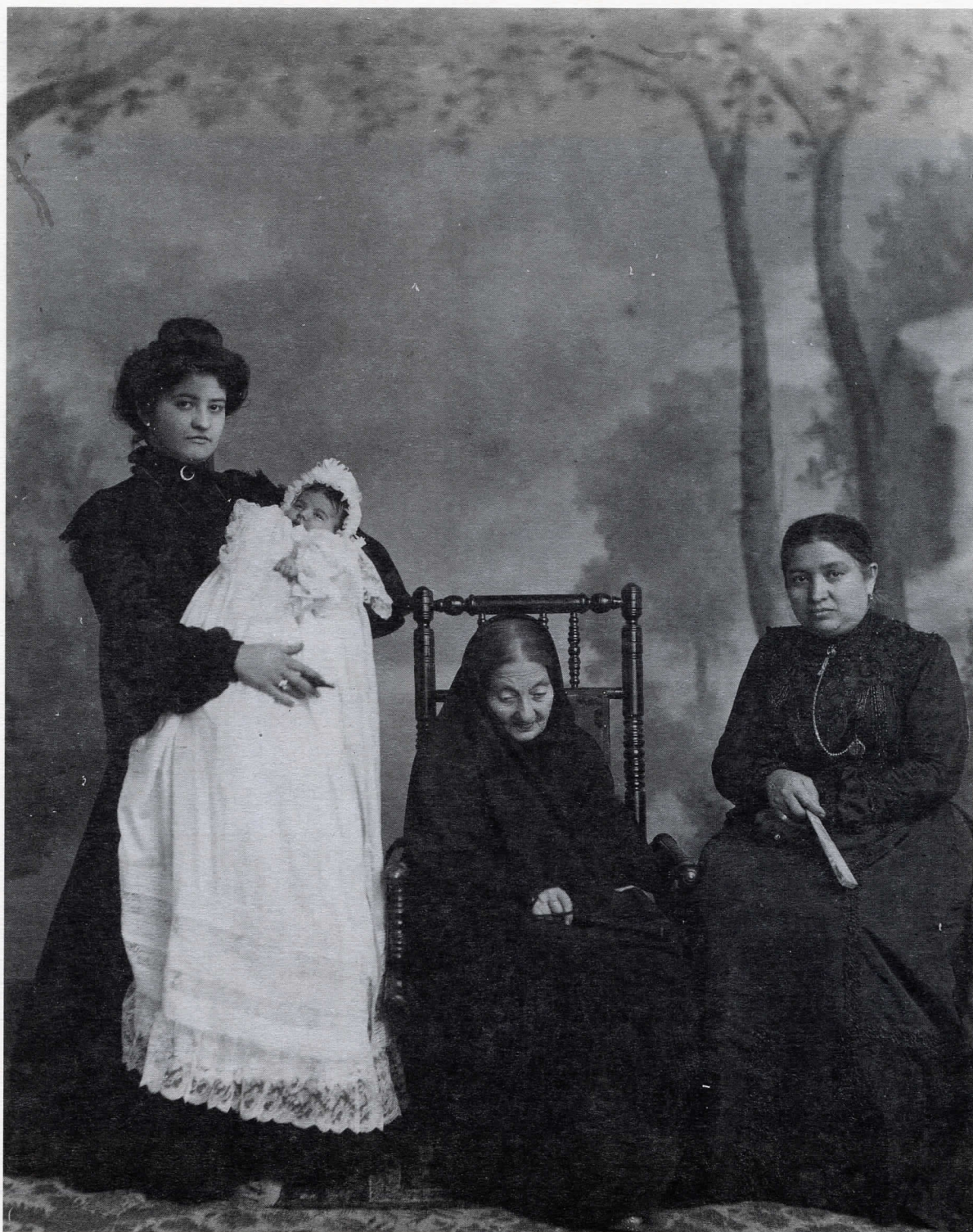
Fotografía 3 (Tercer Lugar)