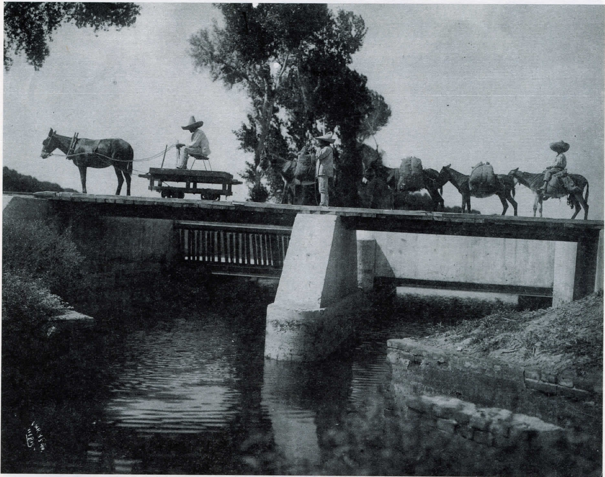
Fotografía 1 (Primer lugar)