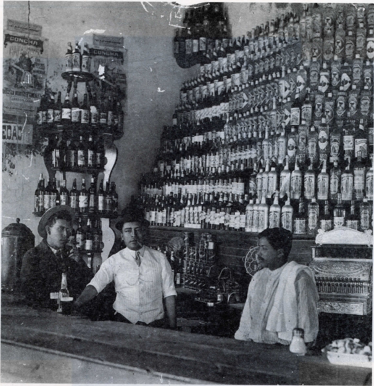
Fotografía 5 (Mención honorífica)