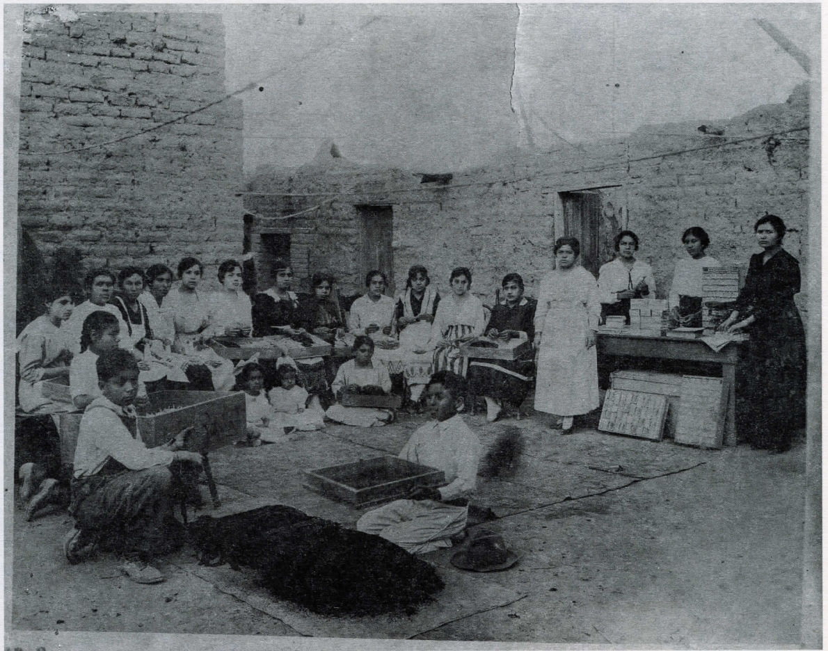
Fotografía 4 (Mención honorífica)