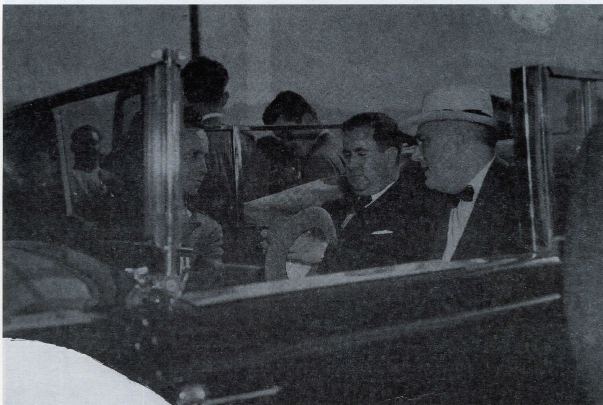
Fotografía 9 (Mención honorífica)